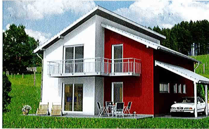
Hinter den beiden farblich getrennten Baukörpern des Entwurfs „Trend 155“ liegen auch unterschiedliche Wohnbereiche. Das Erdgeschoss weist knapp 72, das Obergeschoss 84 Quadratmeter Wohnfläche auf.