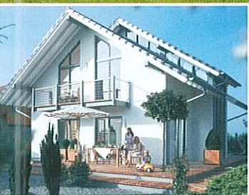
Anschauen & Testen: Aktuelle Musterhäuser