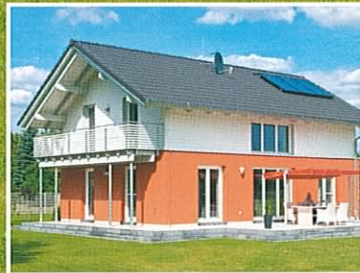
Preiswertes Passivhaus: Schicker Energiesparer

» FENSTER-RATGEBER: Wo sich sinnvoll sparen lässt » BAUEN MIT ZIEGELN: Bewährt, preiswert und vielseitig » RECHTZEITIG ZUM GÜNSTIGEN ZINS: Das bringen Forward-Darlehen » FINANZIERUNGSGESPRÄCH: Optimale Vorbereitung » VORSICHT FALLE: Nachbarschaftshilfe oder Schwarzarbeit?