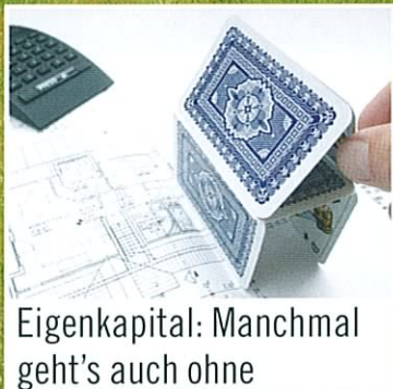
Eigenkapital: Manchmal geht's auch ohne