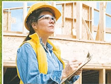
Bauabnahme: Worauf Sie wirklich achten müssen